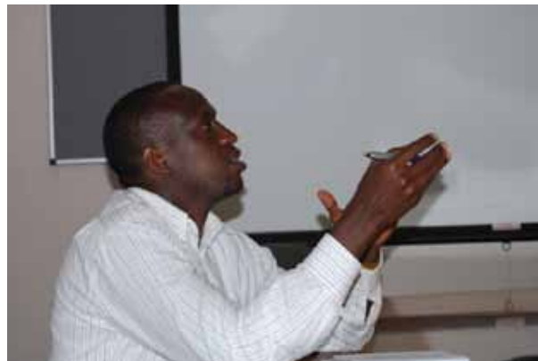
Intervención de KANCO en el taller previo a ICASA