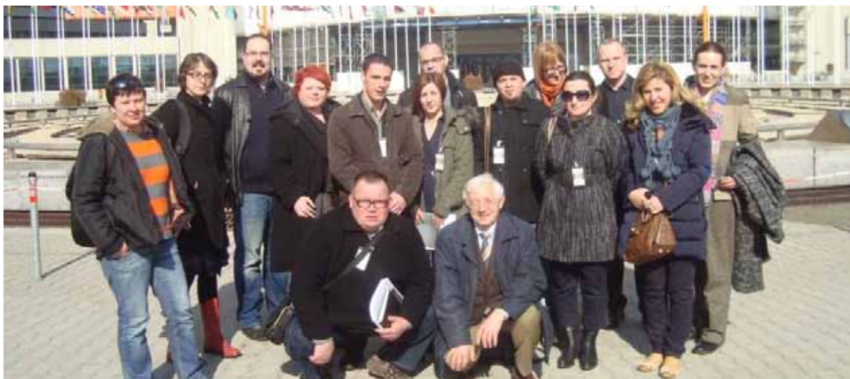
La Red sobre políticas de drogas en el sudeste europeo en el Centro Internacional de Viena, Austria

En marzo de 2012, la Red sobre políticas de drogas en el sudeste europeo (Red SEE) celebró su reunión anual en Viena, Austria. El programa de la reunión, organizada por Diogenis y el IDPC , giró sobre todo en torno a las estructuras internacionales de control de drogas y las convenciones de