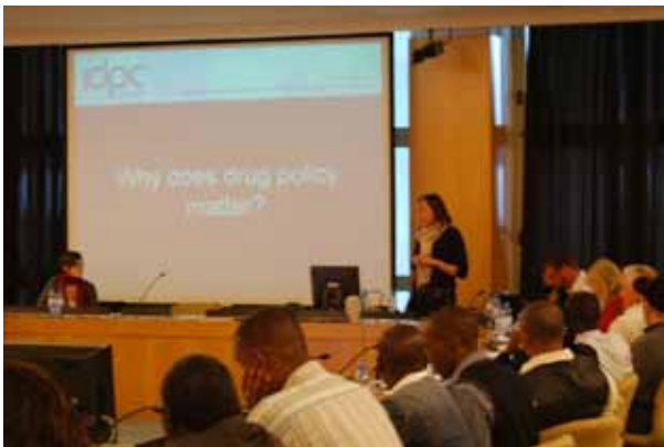
Presentación del IDPC en el taller previo a ICASA

Además, el IDPC y HRI han puesto en marcha un ejercicio de evaluación del que se encargó el centro de conocimientos de la International HIV/AIDS Alliance en Kenia. El ejercicio entrañó, entre otras cosas, una revisión de la literatura y una serie de entrevistas con actores clave de Kenia, Uganda, Tanzania y Etiopía con el fin de recopilar información sobre las políticas de drogas y la situación de la reducción de daños en esos cuatro países. Las conclusiones del estudio se recopilarán en un documento informativo cuya publicación está prevista para los próximos meses.