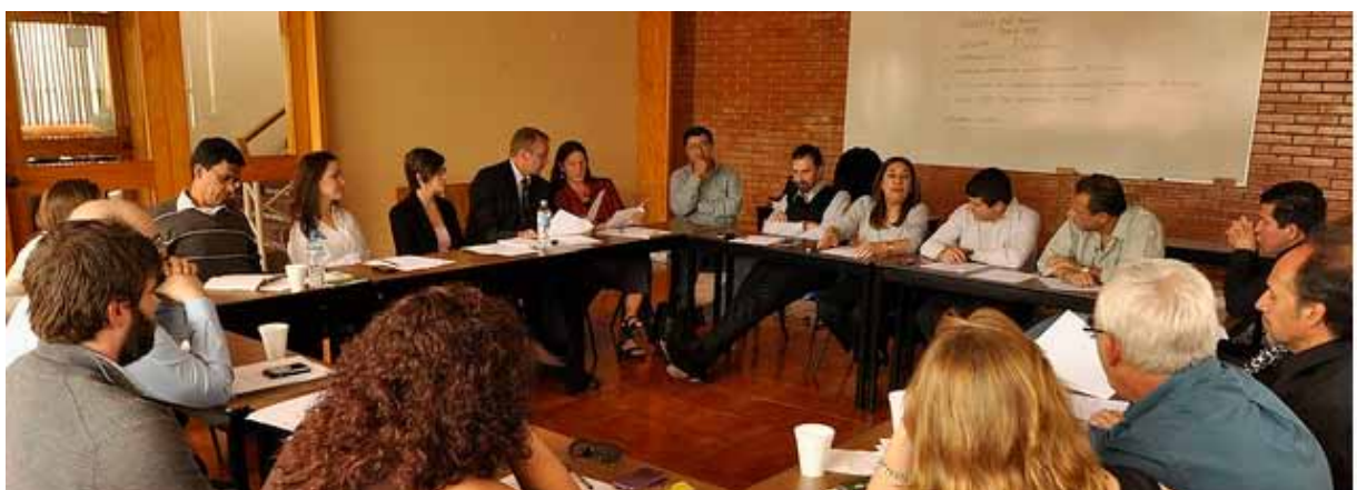
Reunión informal entre ONG y responsables de políticas en la Ciudad de México, México

El punto destacado del trabajo en América Latina este año fue la III Conferencia Latinoamericana y I Conferencia Mexicana sobre Políticas de Drogas. Organizada por Intercambios y CUPIHD , ambos miembros del IDPC, en la conferencia se dieron cita activistas, expertos, funcionarios gubernamentales y otros actores de toda la región. En el marco del encuentro, miembros del IDPC y representantes de la Comisión Global sobre Políticas de Drogas tuvieron la oportunidad de encontrarse con destacados